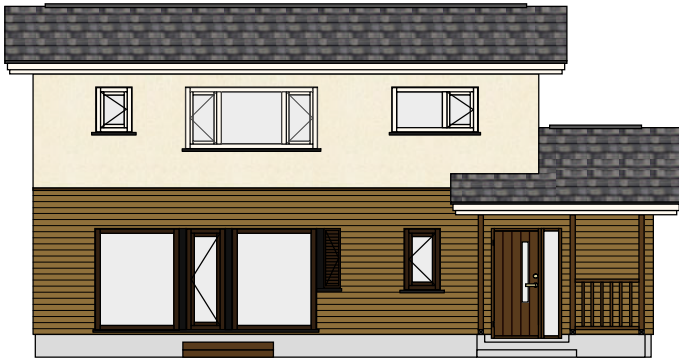
住宅外観イメージ